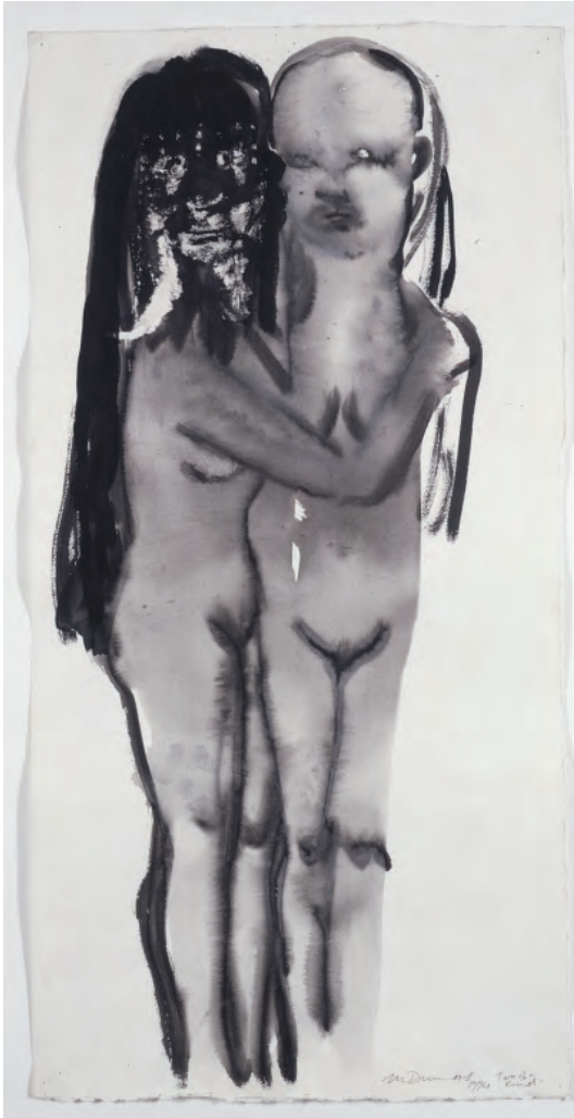
• © Marlene Dumas (1953 Le Cap, Afrique du Sud), Two of a kind , 1994, lavis de gouache et encre de chine sur papier, 96 x 48,2 cm. Collection Frac Picardie