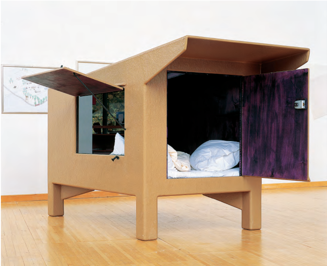
• © Joep van Lieshout (1963 Ravenstein, Pays-Bas), Mini capsule , 2002, installation, bois et résine, 160 × 125 × 270. Collection Frac Alsace.