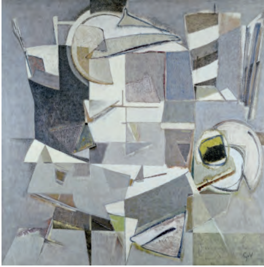
• © Geer van Velde (1898 Lisse, Pays-Bas – 1977 Cachan, France) Composition , 1962, huile sur toile, 190 x 190 cm. Collection Frac Île-de-France © ADAGP