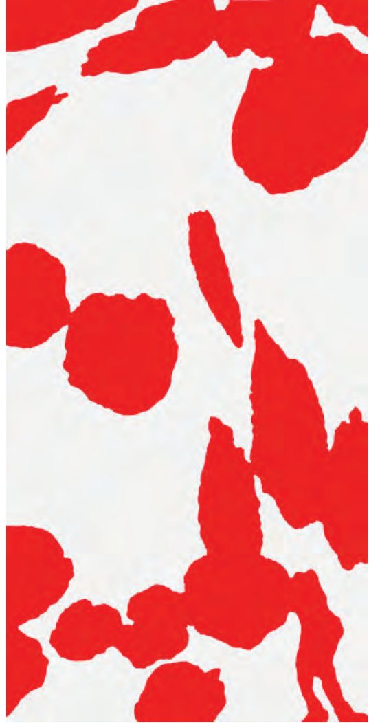
• © Daan van Golden (1936 Rotterdam, Pays-Bas), Heerenlux , 2003, crayon, laque et huile sur toile, 80 x 40 cm. Collection Frac Franche-Comté