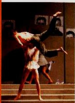
Péplum de Nasser Martin-Gousset.

Avec Péplum , qu'il vient de créer pour la Biennale de Lyon,