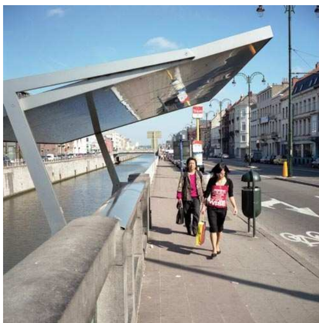
Auvent/Abri de tram de le porte de Flandre, à Bruxelles. Réalisé par MSA Appropriable depuis 2006