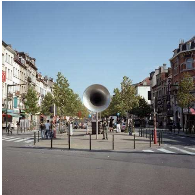
Pasionaria, installation, Porte-voix réalisé par Emilio López Menchero à Bruxelles, Appropriable depuis 2006