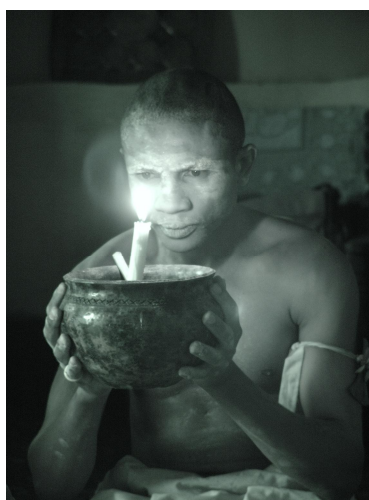
Le divin divin, 2005 Photographies A3 Collection de l'artiste