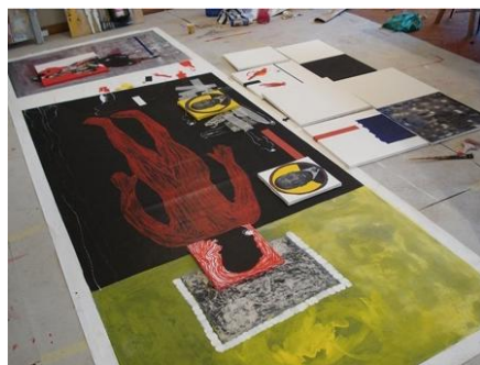
Election 2 , 2007, Polyptique de trois petites toiles, Format total 400 x 140 cm, 2 toiles 30 x 30 cm, 1 toile 50 x 50 cm, Collection de l'artiste © Vitshois Mwilambwe Bondo

Son matériau : les douilles de guerre ramassées au péril de sa vie. Son travail symbolise autant de situations dramatiques banalisées au quotidien.