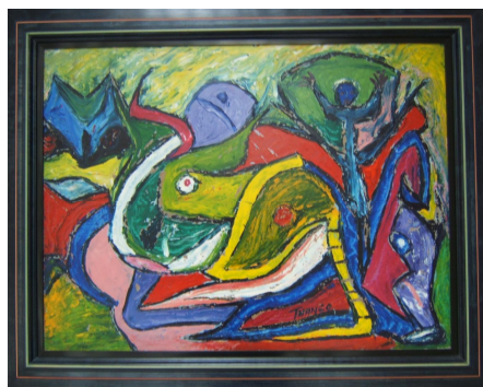
Thango, Sans titre , Années 60, Huile sur isorel (bois compressé), 81 x 63 cm, Collection particulière

Dès 1951, à l'autre extrémité du fleuve Congo, Thango, peintre brazzavillois, installé à Léopoldville et très vite surnommé « le Picasso africain » peint des abstractions ludiques et colorées en aplats, sortes de stylisations animalières rythmées.