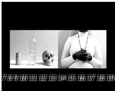
Dis, dis moi comment on dit nature morte aux pays des grands lacs, 2006 Vidéo numérique, 5, 14 mn Collection de l'artiste © Michèle Magema

Michèle Magema, Grand Prix Léopold Sedar Senghor du Dak'Art 2004, vit et crée près de Paris. Tout son processus créatif tourne autour de la mémoire, de l'histoire, de l'exil. Dans ses vidéos et ses photos, elle associe des vérités parfois contradictoires : poésie, sentiment, réalité, discernement, révolte, désir, espoir, refus de l'inertie.