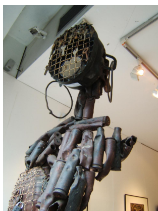
Celle qui a bravé le temps , 2006, Matériaux recyclés, 227 x 64 x 74 cm Collection de l'artiste © Freddy Tsimba

Depuis une dizaine d'années, des jeunes plasticiens congolais émergent se libérant des enseignements académiques souvent réducteurs.