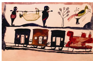
Lubaki, Le train , 1930, Aquarelle sur papier, 32 x 50 cm, collection Eric Kawan

En 1926, Georges Thiry, administrateur colonial, découvre, au Katanga, un mur de case décoré d'une scène naïve, sorte de conte en images. Son auteur : Lubaki, un ivoirier du Bakongo.