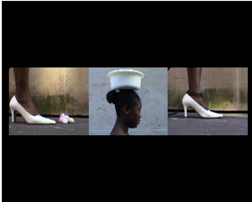
Elément , 2005, Vidéo numérique, 10, 03 mn Collection de l'artiste © Michèle Magma