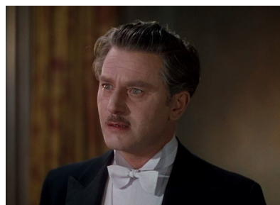
BORIS LERMONTOV ANTON WALBROOK